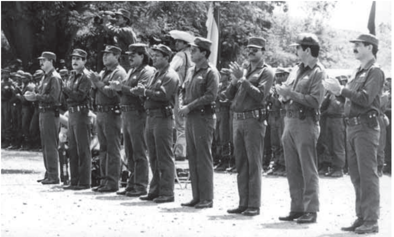
Ascenso al grado de Coronel a los principales Jefes del EPS en la Escuela Facundo Picado, Estelí el 14 de mayo de 1988. (CHM)