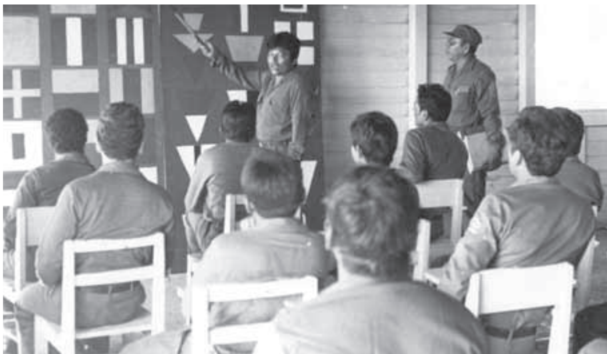
Centro de Preparación de Especialistas Menores de la Marina de Guerra Sandinista. (DRPE)

Para elevar el nivel académico de jefes y oficiales, en este mismo año, se implementó el programa de becas nacionales