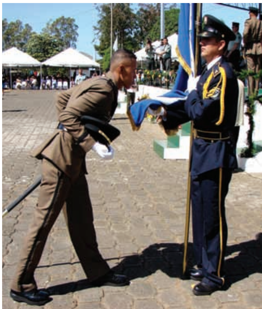
Compromiso ante la Bandera Nacional por caballero cadete al momento de su graduación en el Centro Superior de Estudios Militares “General de División José Dolores Estrada Vado”. (DRPE)

Imparte además los Cursos de Perfeccionamiento de Oficiales (CPO), inglés, computación y otros.