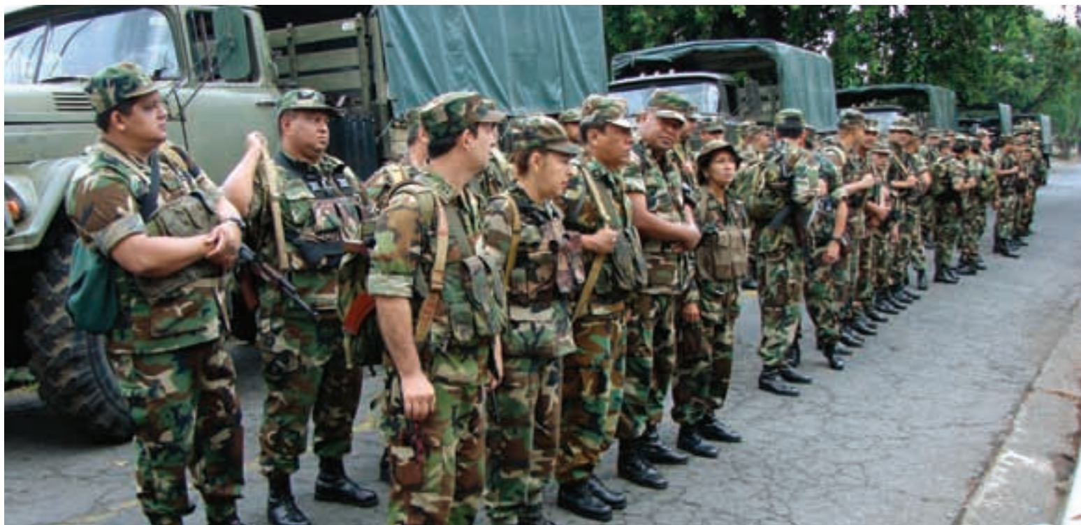
Adiestramiento de oficiales del Estado Mayor General. ( DRPE)

El segundo está referido a las Direcciones y Órganos de la Comandancia y Estado Mayor General, Estados Mayores y Planas Mayores de las unidades militares. Lo integran oficiales de todos los niveles. Incluye la preparación de jefes y oficiales, reunión de especialistas, ejercicios, caminatas, preparación física, infantería, natación, adiestramiento de tiro con armas de infantería y entrenamientos.