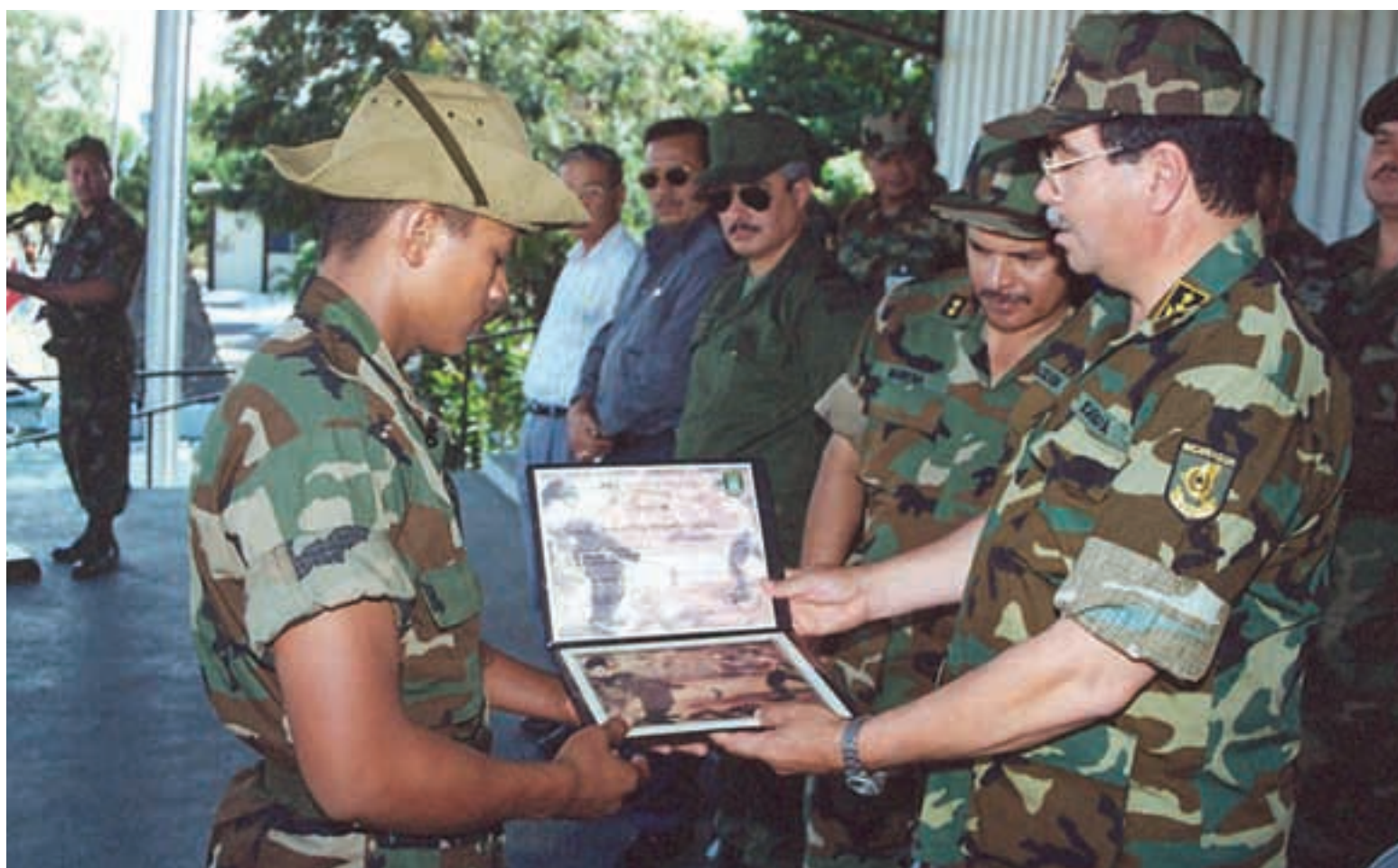
Graduación de sargentos en la Escuela Nacional de Sargentos "Sargento Andrés Castro". (DRPE)

conocimientos básicos en correspondencia con las misiones del Ejército de Nicaragua. Los educa bajo los principios morales, cívicos, patrióticos y éticos, y en el respeto a la Constitución Política y las leyes del país.