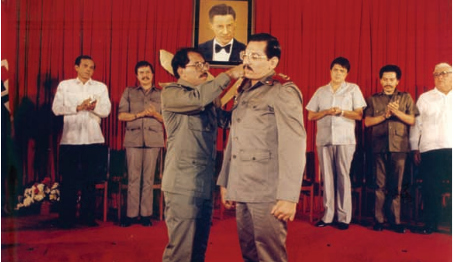
Acto de conversión de grados militares y ascenso a General de Ejército al Comandante de la Revolución Humberto Ortega Saavedra por el Presidente de la República, Comandante de la Revolución Daniel Ortega Saavedra, el 22 de agosto de 1986.

para la realización de estudios en la Universidad Nacional Autónoma de Nicaragua (UNAN-León). Los primeros becados favorecidos con este programa, ingresaron en la carrera de Derecho.