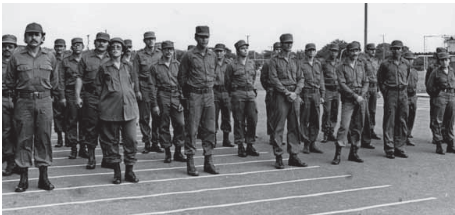
Acto de ascenso en grados de honor en la ECA, el 15 de julio de 1980. (CHM)

El 15 de julio de 1980, se celebró el primer acto de ascenso en grados de honor y militares del EPS. En conformidad con el Decreto Ley No. 429 “Ley creadora de los grados de honor, cargo y grados militares”, de la JGRN, aprobada el 17 de mayo 1980. Fueron ascendidos 207 oficiales (4 Comandantes de Brigada, 14 Comandantes, 5 Subcomandantes, 27 Capitanes, 42 Tenientes Primeros, 55 Tenientes y 59 Subtenientes).