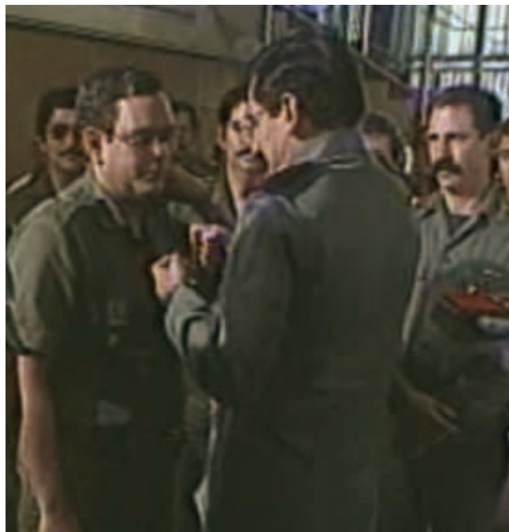
Conversión de grados de Comandante de Brigada a Coronel del EPS, el 22 de agosto de 1986. (DRPE)

Entre marzo y junio de 1990, se llevó a cabo la reestructuración cuantitativa, ésta consistió en dar continuidad a la reducción de efectivos de personal permanente, reservista y miliciano, que había comenzado en el año anterior. En marzo del mismo año, fueron desmovilizados los reclutas del Servicio Militar Patriótico (SMP). El EPS se redujo de 86,810 efectivos existentes en enero a 41,140 al mes de mayo.