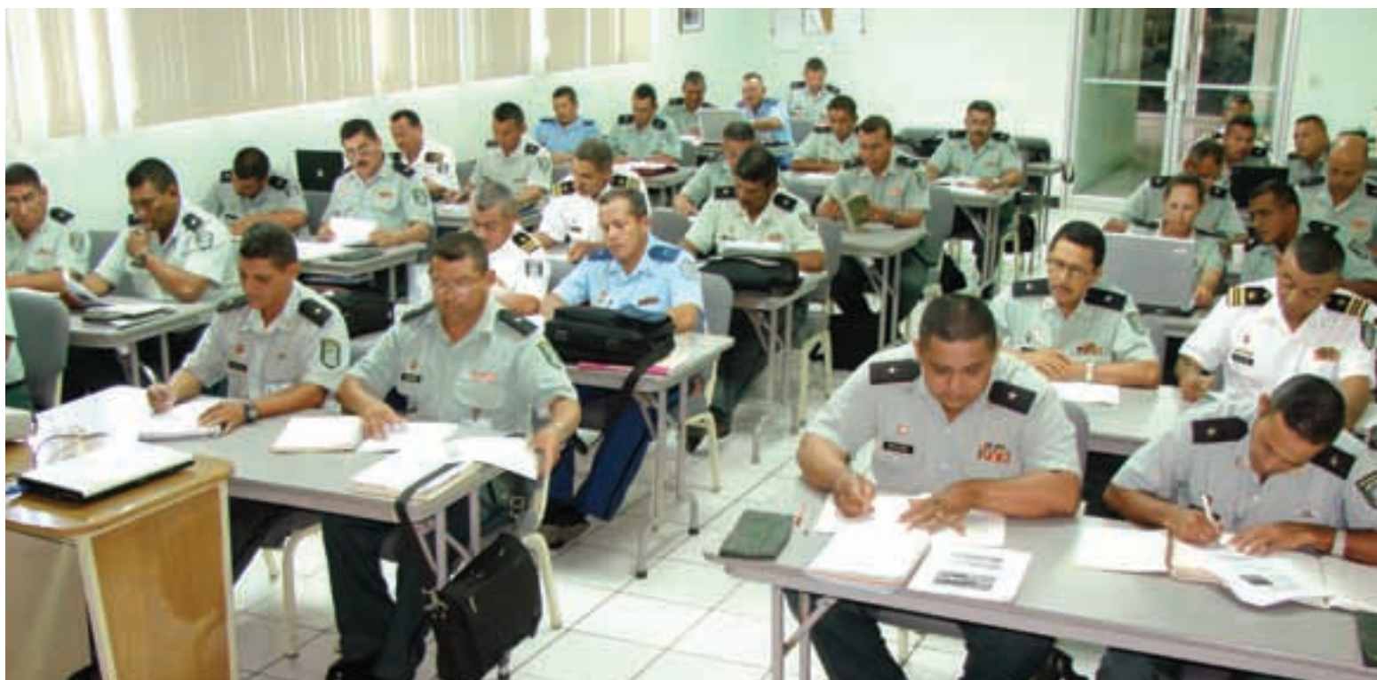
Curso de Diplomado de Estado Mayor en la Escuela Superior de Estado Mayor “General Benjamín Francisco Zeledón Rodríguez”, 2009. (DRPE)

El 23 de marzo de 1998, se fundó la Escuela Nacional de Adiestramiento Básico de Infantería “Soldado Ramón Montoya” (ENABI), dirigida a preparar a los soldados de nuevo ingreso. Esta escuela les proporciona