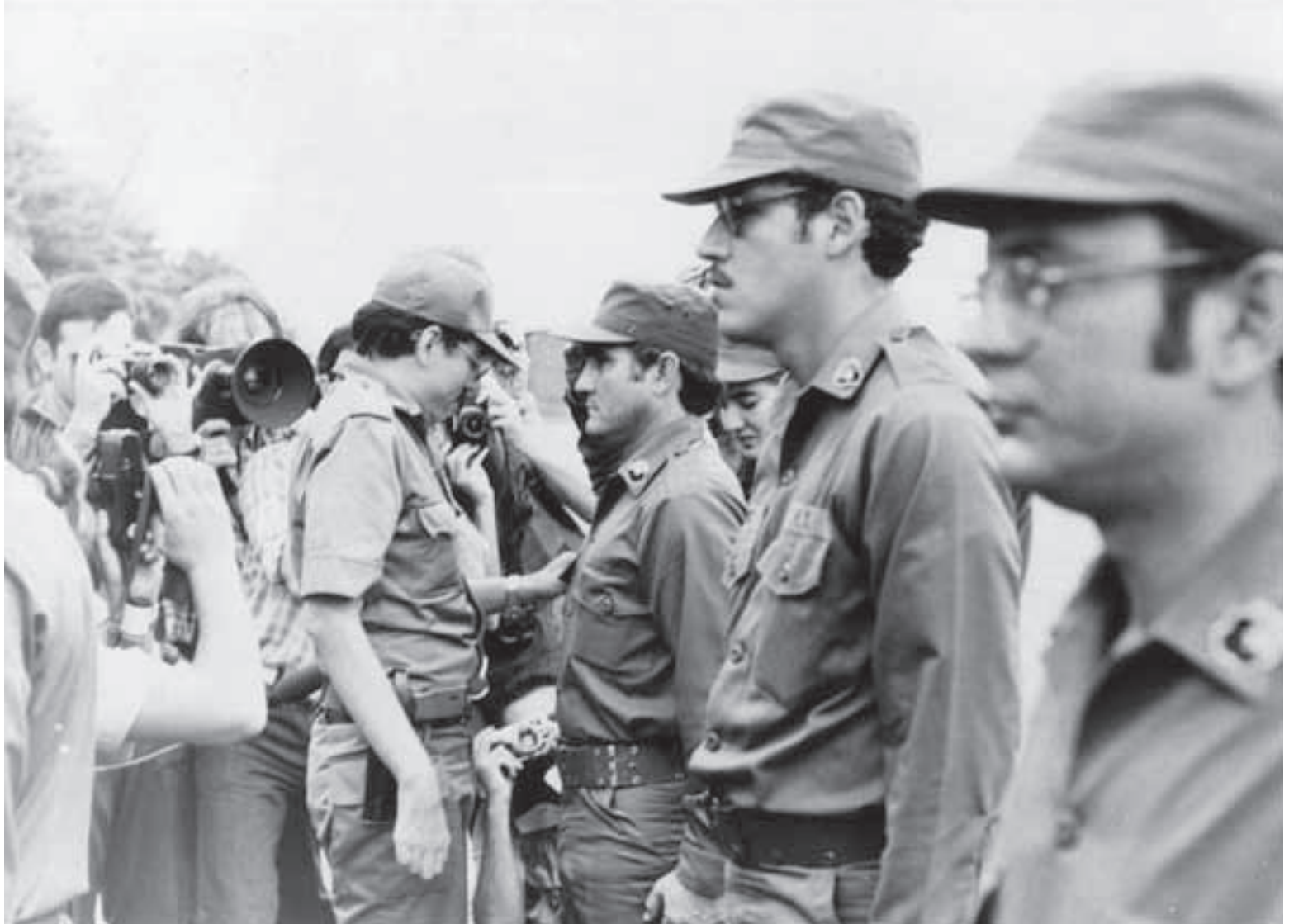
Ascenso a Comandantes de Brigada en la ECA, el 15 de julio de 1980.

La Escuela “Eduardo Contreras Escobar” fue fundada en Apanás, departamento de Jinotega en septiembre de 1980, en este centro se impartieron cursos a pequeñas unidades de Reserva y Milicias Populares Sandinistas (MPS).