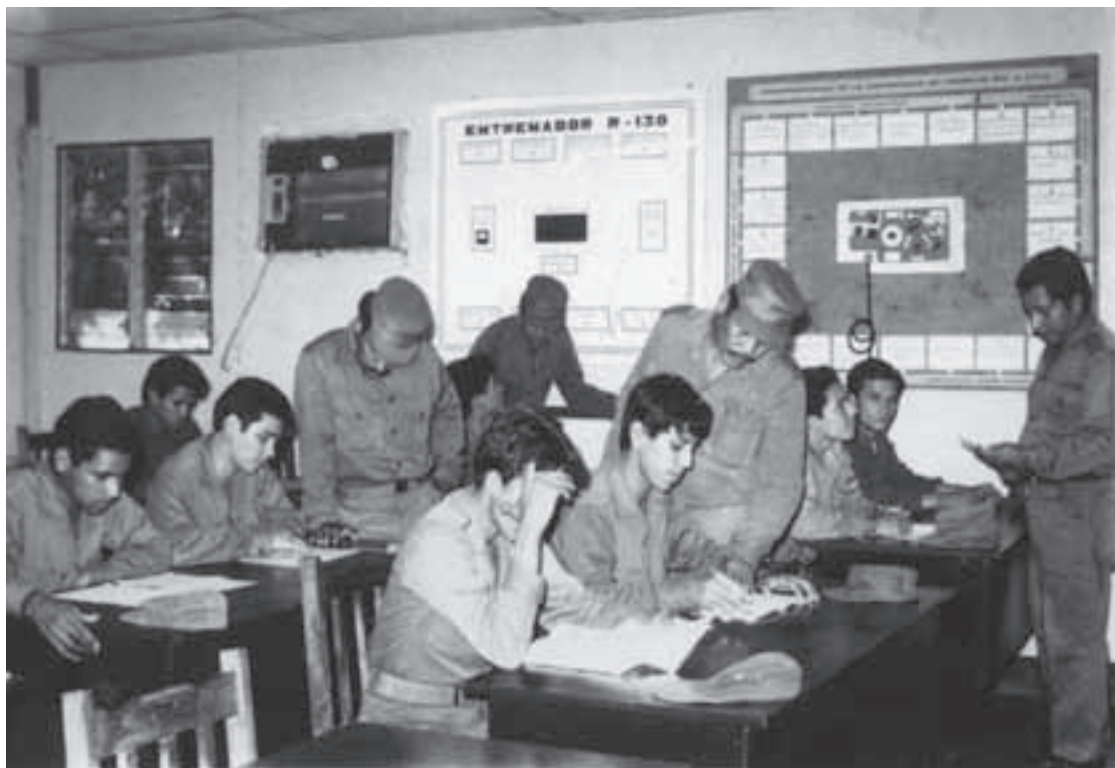
Preparación de especialistas menores de comunicaciones.

En ese mismo año, comenzaron las labores académicas en cuatro Centros de Preparación de Oficiales (CPO), que fueron: CPO General Pedro Altamirano (en Condega), CPO Arlen Siú (en El Sauce), CPO Comandante de Brigada Hilario Sánchez (en Amayito) y CPO Pedro Aráuz Palacios (en Juigalpa). Se prepararon a oficiales permanentes, de reserva y de las MPS para ocupar cargos en la nueva estructura. Se les preparó para ser capaces de dirigir y realizar acciones combativas de carácter regular e irregular. Se mantuvo la capacidad de relevo y reposición de bajas.