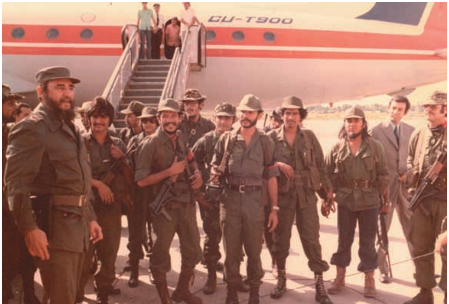
Jefes guerrilleros del FSLN y el Comandante Fidel Castro Rúz, el 26 de julio de 1979 en Cuba.

El Ejército Nacional estará formado por los combatientes del Frente Sandinista de Liberación Nacional; por los soldados y oficiales de la Guardia Nacional de Nicaragua que hayan demostrado una conducta honesta y patriótica frente a la corrupción, represión y entreguismo de la dictadura y de los que se hayan sumado a la lucha por el derrocamiento del régimen somocista; por quienes hayan combatido por la liberación y desearan incorporarse, por los ciudadanos aptos que oportunamente presten su servicio militar obligatorio. No tendrán cabida en el nuevo Ejército Nacional los militares corruptos y culpables de crímenes contra el pueblo”.