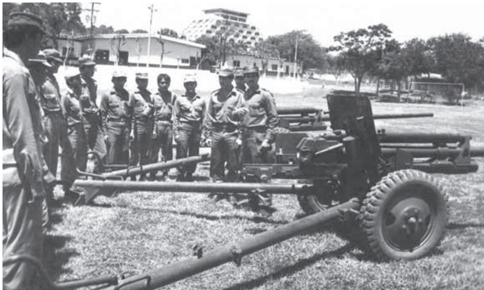
Preparación de oficiales de artillería terrestre en la Escuela "Carlos Agüero".