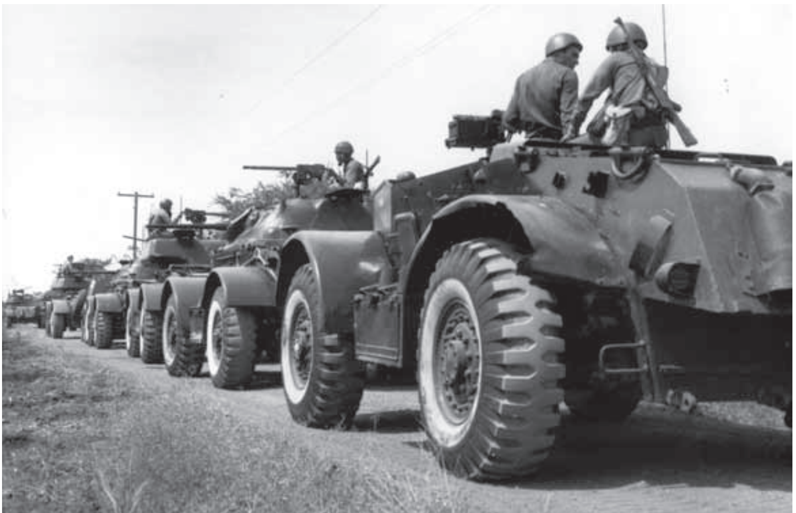
Batallón Blindado del EPS.