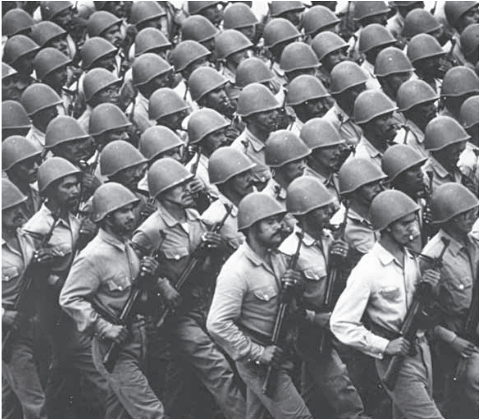
Desfile de unidades de infantería permanente del EPS. (DRPE)

Regiones Militares: La creación de estas unidades conllevó un proceso de transformación de las estructuras irregulares a estructuras regulares que habían actuado en todo el país durante la insurrección. (frentes guerrilleros, zonas, regiones, sectores, brigadas, bases, comandos, etc.) a estructuras regulares.