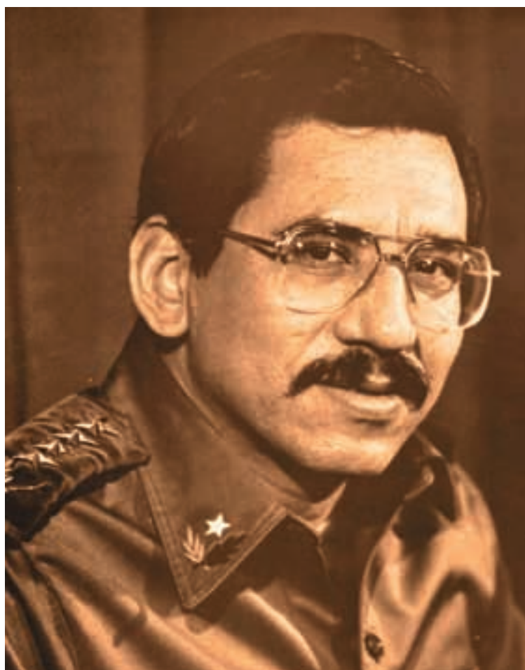
Comandante de la Revolución Humberto Ortega Saavedra, Comandante en Jefe del EPS de 1979 a 1995. (CHM)

También estableció que: “los mandos del Ejército Nacional, se integrarán provisionalmente con los jefes militares y dirigentes del movimiento armado que puso fin a la dictadura, y los oficiales de la Guardia Nacional incorporados a la lucha. La organización y estructuración del Ejército Nacional, será regulada por el Gobierno de Reconstrucción Nacional que le dará sus leyes y reglamentos”.